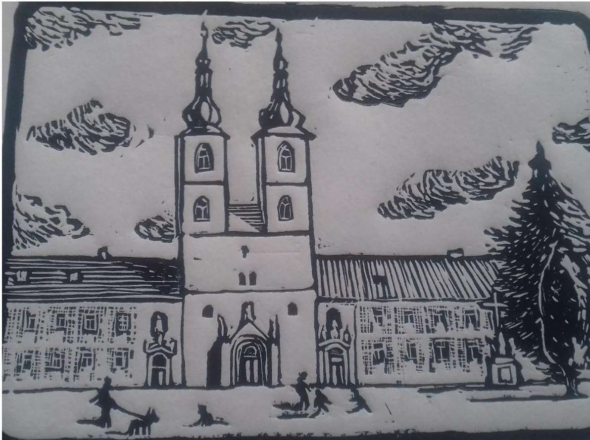
Mědirytina tepelského kláštera