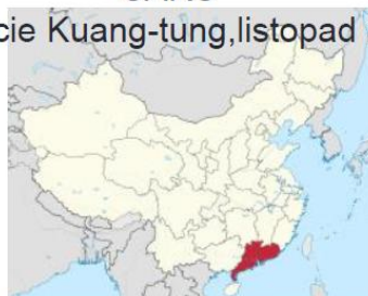
SARS Provincie Kuang-tung, listopad 2002