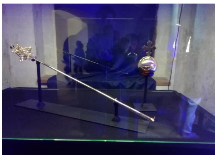
stříbrné žezlo a jablko