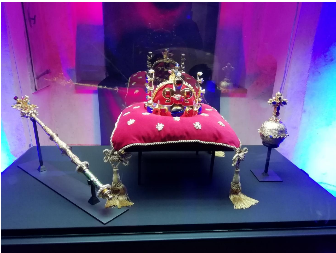
zlaté korunovační klenoty – na koruně 96 drahých kamenů